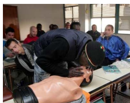
Santa Pola forma a 17 personas para poder faenar en el mar.