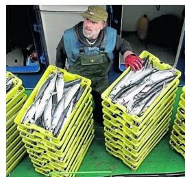
La xarda como agravio pesquero.